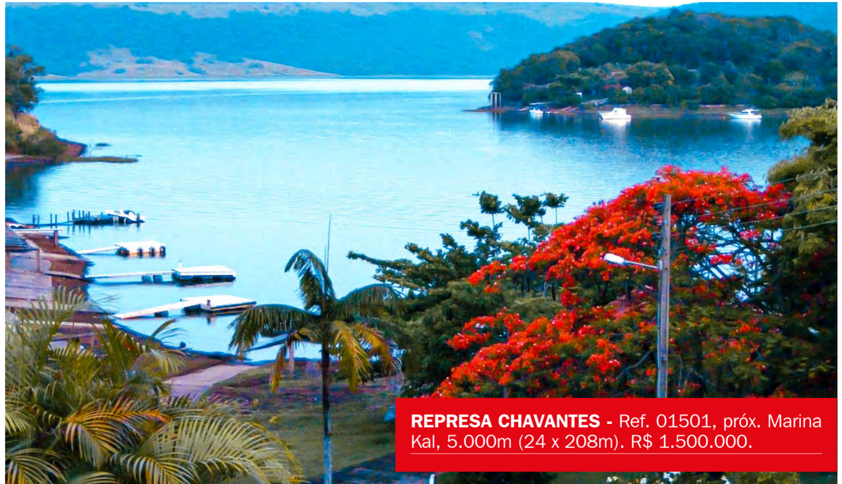
REPRESA CHAVANTES - Ref. 01501, próx. Marina Kal, 5.000m (24 x 208m). R$ 1.500.000.

SANTA FÉ II - Ref. 351, 3 dorms, sendo 1 suíte c/ moveis planejados, ar condicionado, wc social, sala, sala tv, cozinha, garagem, portão automatizado.